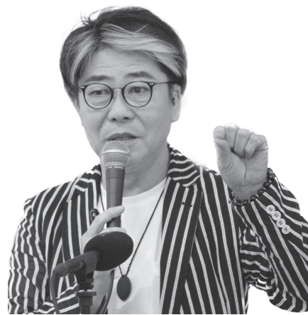
船井本社グループ株式会社本物研究所 代表取締役社長