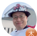
マグロともかず マグロプロジェクト 主催